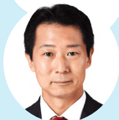
衆議院議員 神田 潤一 氏