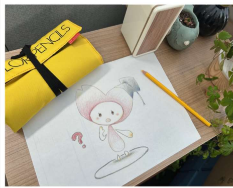
▲表紙イラスト（案）の製作