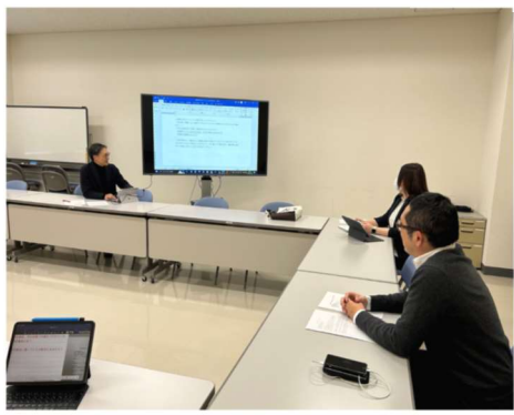
▲事業担当者の打ち合わせ風景