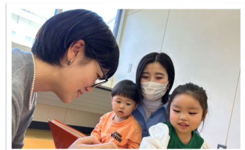
▼絵本の読み聞かせの様子

訪問を希望する保育施設や小学校を募集しますので、ぜひご要望ください。ホームページ上では、随時、活動報告をさせていただきます。